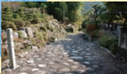
石畳 かつて足尾銅山から江戸へ銅を運ぶために使われた銅（あかがね）街道。(近年復元)