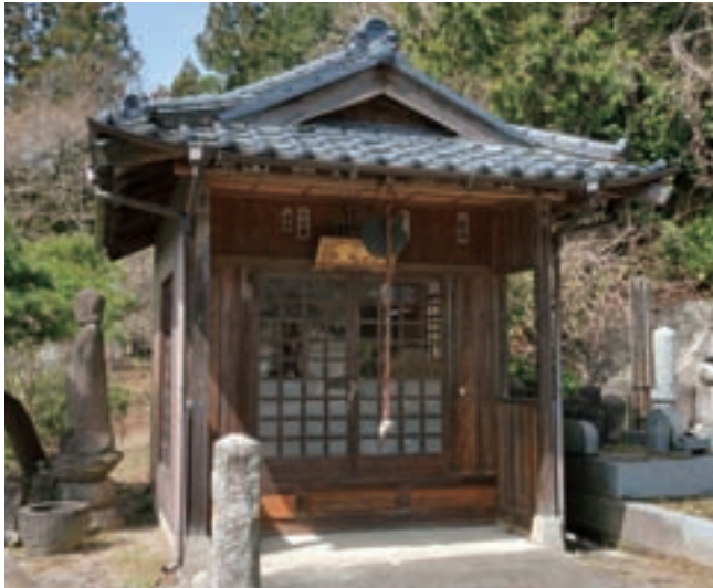
だいたくじ 大澤寺 (福祿寿)

境内に庚申堂があり、祀ら おして れている庚申像は、弘法大師が押出川より引きあげたものと伝えられている。もともとは、押出川右岸中腹の岩戸観音窟に祀られていたが、その後明治維新の際にこの地に移された。また、福祿寿は、庚申堂の右側に安置されている。