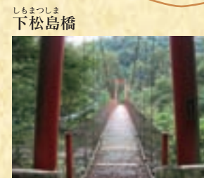
しもまつしま 下松島橋