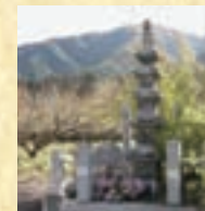
せきぞうごじゆうのとう 石造五重塔