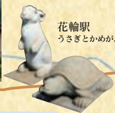
花輪駅 うさぎとかめがお出迎え